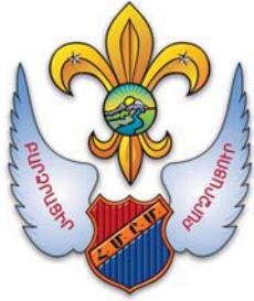
Հ. Մ. Ը. Մ.ի Շուշանաձաղիկը (Տես՝ յօդուած 134, էջ 46)